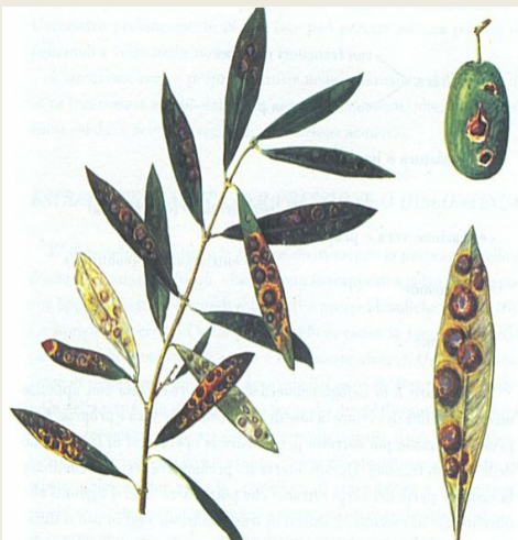
- Cicloconio dell'olivo o occhio di pavone. Danni su foglie, danni su drupa, particolare dell'attacco su foglia.

Sono presenti sulle foglie vecchie di alcuni oliveti le tipiche manifestazioni della malattia dovute ad infezioni sviluppatesi durante il periodo autunno invernale. Le alte temperature e l'assenza di precipitazioni rendono inutile l'eventuale impiego di prodotti fitosanitari.